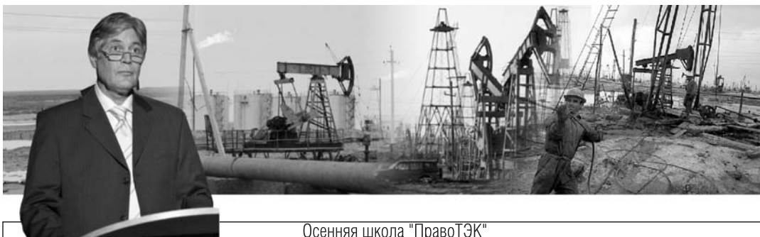
Осенняя школа "ПравоТЭК"